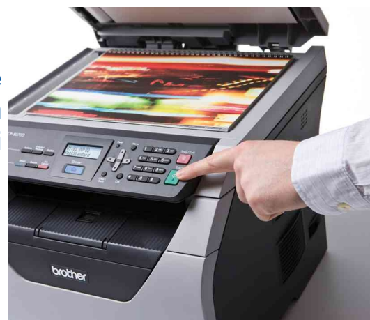
Scansione a colori di documenti in formato A4.

DCP-8070D è la macchina veloce e compatta, dalle alte prestazioni, che racchiude stampante, copiatore e scanner a colori con unità fronte retro automatica in stampa e toner opzionale ad alta capacità per ridurre i costi di gestione.