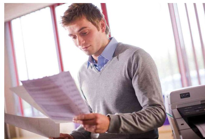
Stampa veloce a 28 ppm in A4