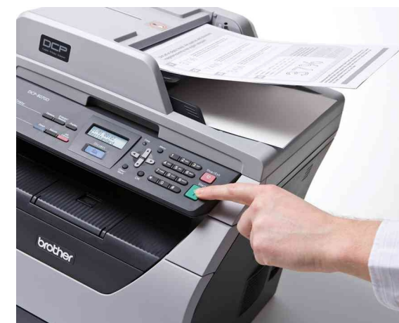
ADF – ideale per la copia o la scansione di documenti composti da più pagine